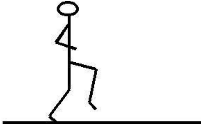
Courir en montant les genoux

Pendant 2 minutes, au signal les 4 groupes se déplacent. Au signal les vous courez sur 15 mètres (jusqu'au plot suivant) en montant les genoux puis en marchant vous vous rendez au plot suivant et vous enchaînez les courses en montant les genoux et les marches.